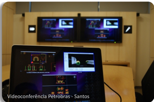
Videoconferência Petrobras - Santos

Combinando tecnologia e infraestrutura, a absolut technologies integra, com a Telepresença, uma experiência única de colaboração onde pessoas participam de reuniões em locais diferentes, dando-lhes a sensação de estarem em um mesmo ambiente. Isso só é possível devido à utilização de imagens em tamanho real, ambientação das salas para que sejam similares em todos os